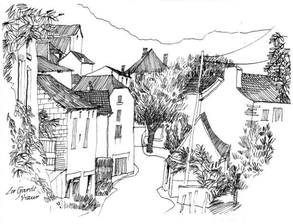
Lagarde Viaur

(Participation libre pour le prix de l'emplacement)